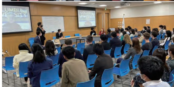
日本語のハイブリッドセッション(上)、英語のハイブリッドセッション(下)

「GraSPP龍岡会インド・ニューデリー支部始動！2021年4月からインドに駐在しています。GraSPP龍岡会インド・ニューデリー支部では私を含めたGraSPP修了生4人(インド人2人、日本人2人)が定期的に集まっています。10月15日には私の自宅に集合してオンラインで参加しました。GraSPP関係者の皆さん、ニューデリーにお越しの際は是非お声かけください〜！」