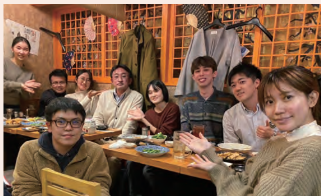
履修者との打ち上げ