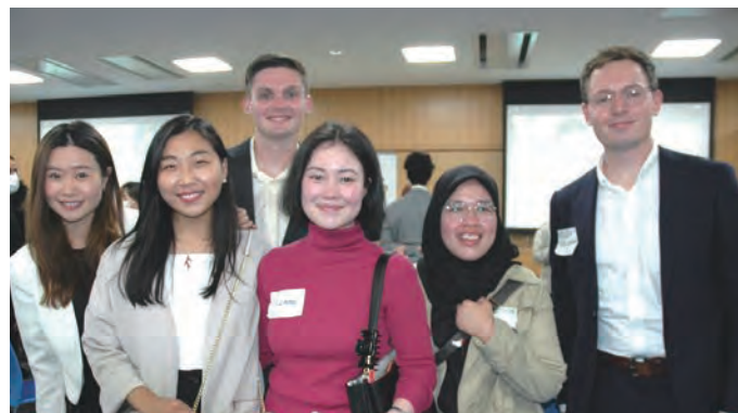
対面でのチャットセッション