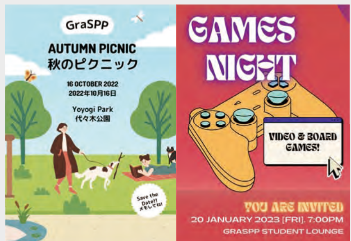
Events organized this semester

It is great to see the campus so alive again. We really enjoy the interaction with the students and plan to organize many networking events in the coming semester. In the semester break as well, we will continue to be available via social media, email, and on-site to answer students' questions.