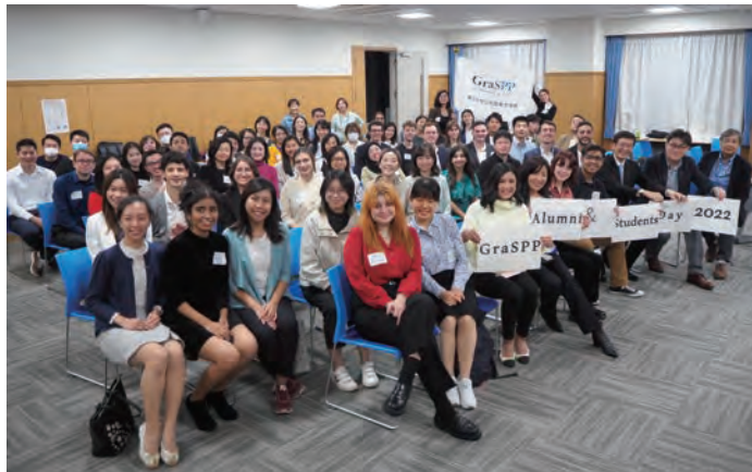
ハイブリッド全体セッションのあとで

2022年10月15日、土曜夜にハイブリッド開催したGraSPP Alumni & Students Day 2022には国内外から100人以上のGraSPPersが参加しました。同窓生同士が再会し、在校生や教職員と親睦を深めた様子を報告します。